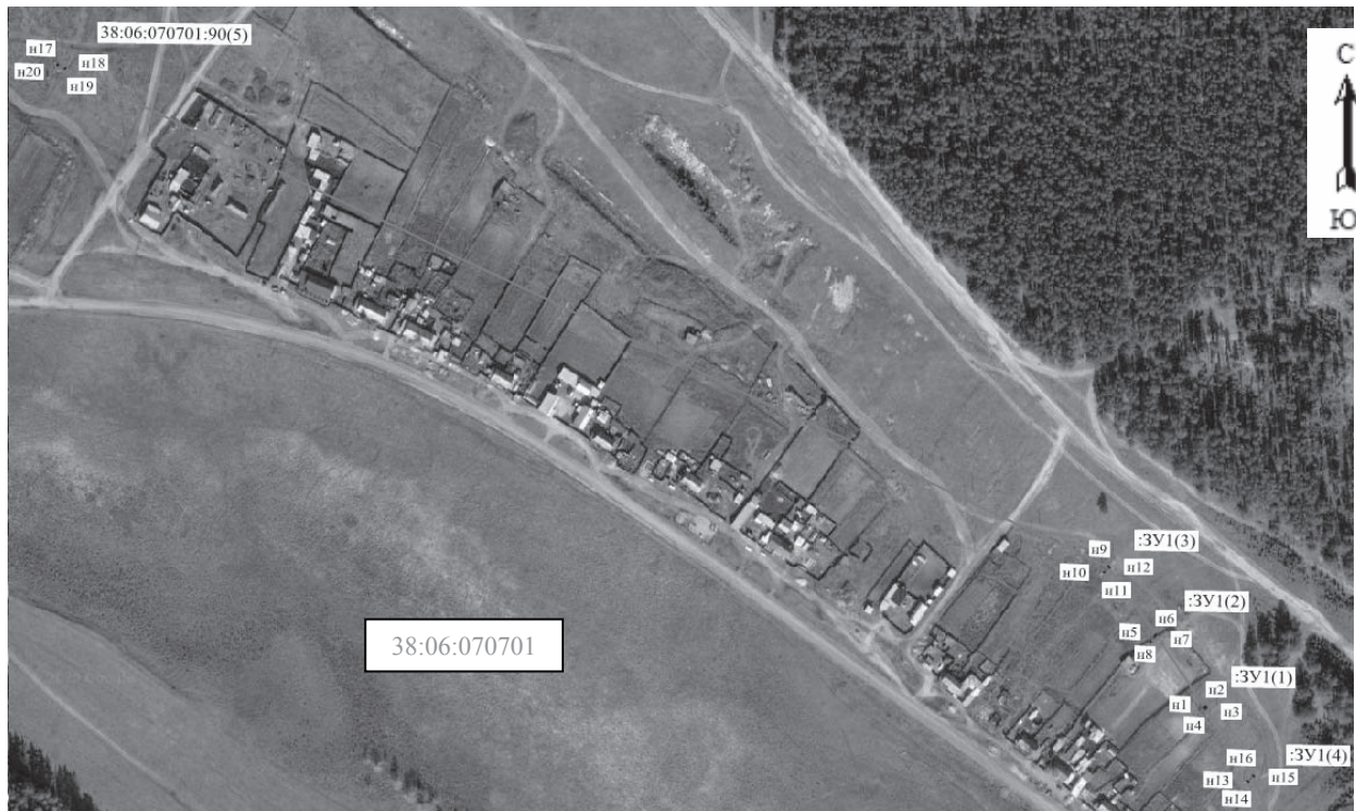
Масштаб 1:5 000