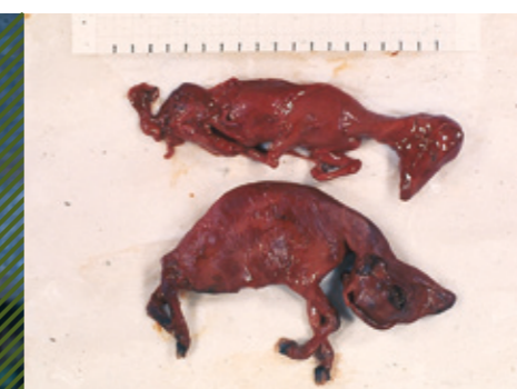
Абортированные мацерированные плоды с признаками тортиколлиса