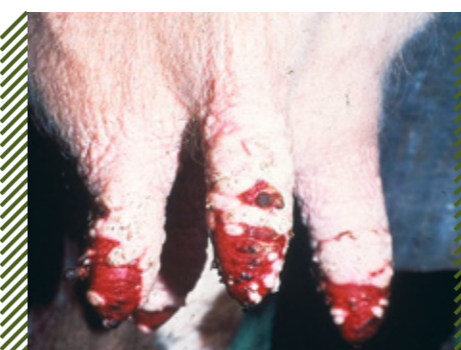
Экстенсивное сливное изъязвление кожи соска вымени у КРС