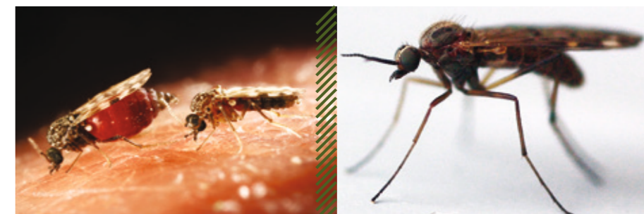
Мокрецы рода Culicoides

вирусная, трансмиссивная болезнь жвачных животных, характеризующаяся воспалительно-некротическими поражениями слизистой оболочки ротовой полости, особенно языка, желудочно-кишечного тракта и основы кожи копыт, а также дистрофией, изменениями скелетной мускулатуры.