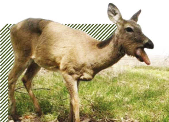
Отечность слизистых оболочек ротовой полости и языка