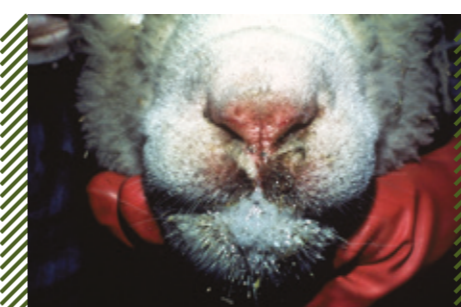
Эрозии крыльев носа и слюнотечение у МРС

Приказ Министерства сельского хозяйства РФ от 25 ноября 2020 г. N 706 "Об утверждении Ветеринарных правил осуществления профилактических, диагностических, ограничительных и иных мероприятий, установления и отмены карантина и иных ограничений, направленных на предотвращение распространения и ликвидацию очагов блютанга".